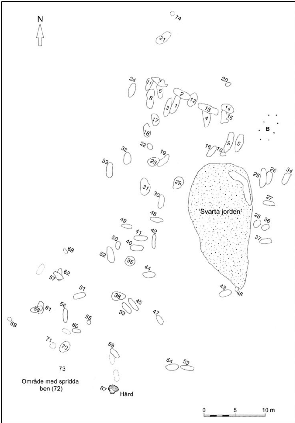
Figur 4. Gravarna på Ajvide. De streckade gravarna (nr. 63-75) är ännu inte fullständigt publicerade och dess form, numrering och exakta placering är osäker. I området har även ett hundratal stolphål identifierats, inklusive en mindre byggnad (B), samt ett område med mycket svartfärgad jord. (Modifierad från Burenhult 2002, samt rapporter på Ajvides Hemsida).