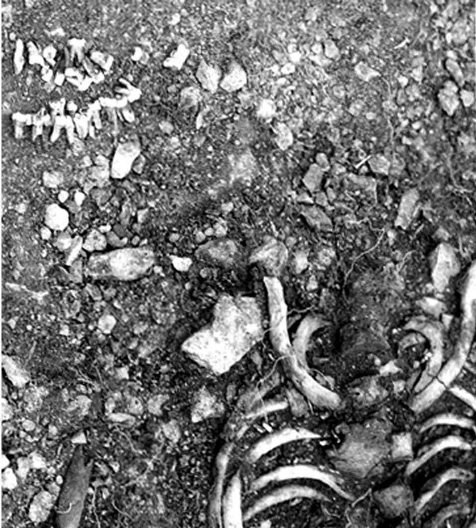
Figur 3. Grav nr 6. Skallen har grävts upp efter att all mjukvävnad förmultnat varpå tänderna 'återbegravts' i anatomisk ordning med undantag av ett par som ersatts med djurtänder.

gravarna'. Inga av de öst-västligt orienterade gravarna är kenotafer. Vi finner även en skillnad mellan norr till söder där de öst-västliga gravarna gradvis ökar i omfattning för att i södra delen övervägande vara anlagda i den riktningen. Vi kan även notera att riktningen på gravarna i mellandelen verkar mindre betydelsefull. Gravarna 28, 36, 29, 23, 35 är exempelvis snarare runda än ovala vilket annars mest förekommer i barngravarna. Även här kan vi se hur praktiker från det nordliga klustret tunnas ur på mellandelen för att sedan bli diffus och mångtydig bland de sydliga gravarna.